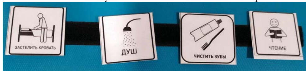
Рис.2 Расписание дня с карточкой «Чистить зубы»

• В течение дня обсуждать, что все чистят зубы, играть в чистку зубов куклам и игрушечным животным, читать книги о чистке зубов. Обсудить последствия отказа от чистки